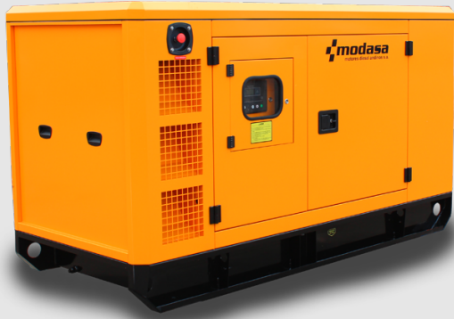
GRUPO ELECTRÓNICO INSONORO