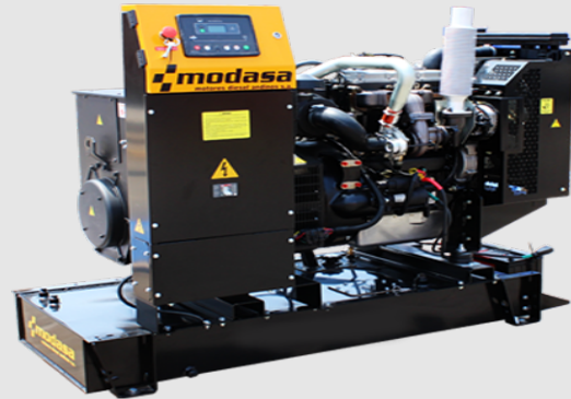
GRUPO ELECTRÓNICO ABIERTO

* Nota: Imágenes referenciales, pueden variar dependiendo de los accesorios